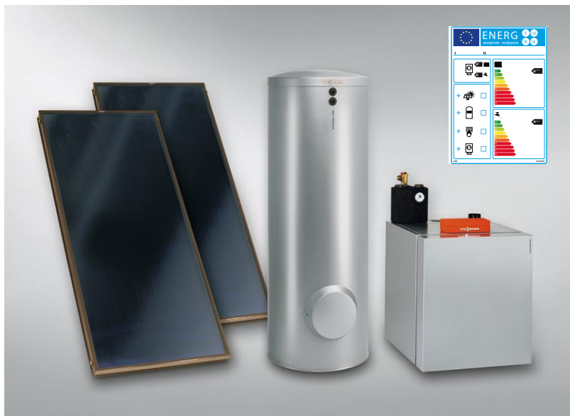
Informację o efektywności energetycznej zestawu urządzeń zawiera jedna etykieta

Kompletny program produktów Viessmann zawiera wszystkie składniki systemowe, niezbędne do konfigurowania instalacji, złożone z dokładnie dopasowanych do siebie urządzeń – łącznie z inteligentną elektroniką – co niezależnie od wybranej konfiguracji gwarantuje zawsze maksymalną efektywność energetyczną zestawu.